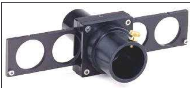
1. Preis: 5-fach Filterschieber für 1,25 Zoll, im Wert von 100,-€

1. Preis Filterschieber. Im Wert von 100,- €